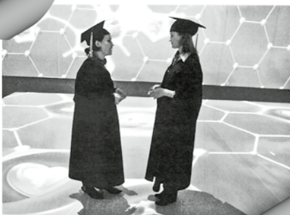
Магистр почти не виден

Российская Газета http://www.rg.ru/2013/03/07/unst.html